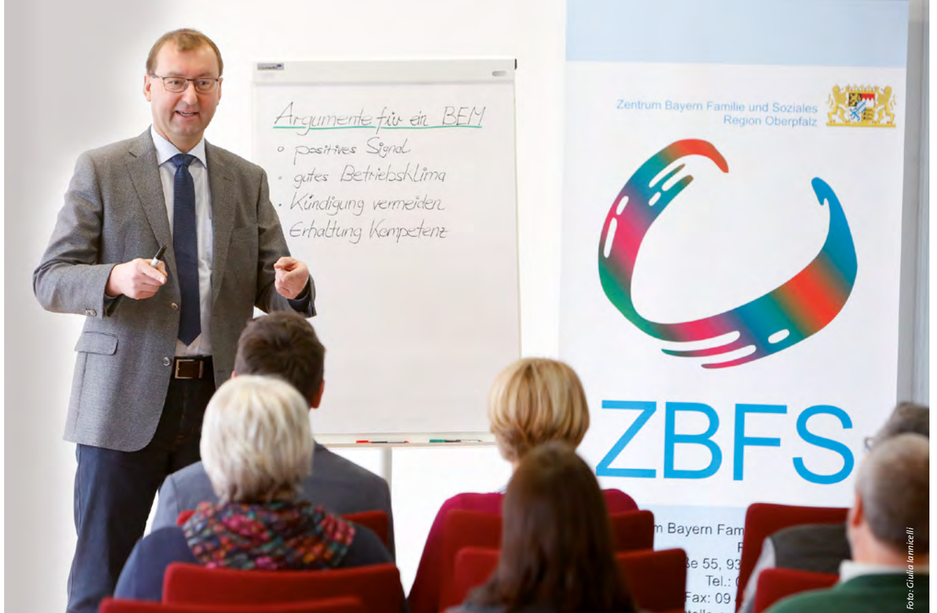
In Kursen vermittelt das Inklusionsamt den Vertrauensleuten das erforderliche Fachwissen für die Arbeit.