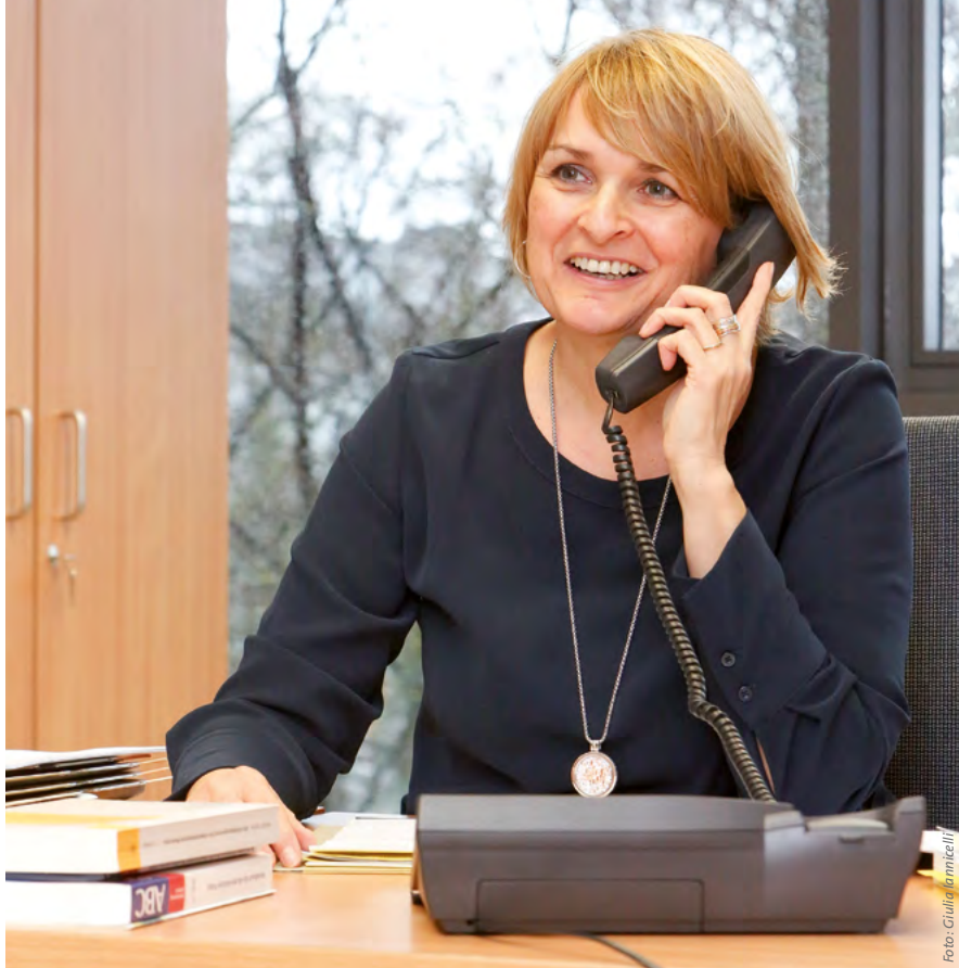
Bei allen Fragen zur Beschäftigung schwerbehinderter Menschen können sich die SBV ans Inklusionsamt wenden.

tigte. Ein Beispiel ist die Kostenerstattung für eine Arbeitsassistenz. Der schwerbehinderte Mensch leistet dabei die arbeitsvertraglich vereinbarte Tätigkeit selbst, die Assistenzkraft hilft und unterstützt ihn aber dabei, etwa bei Menschen mit Sehbehinderung durch das Vorlesen von Unterlagen. Besteht ein besonderer Bedarf an arbeitsbegleitender Betreuung, leisten die Integrationsfachdienste Unterstützung vor Ort.